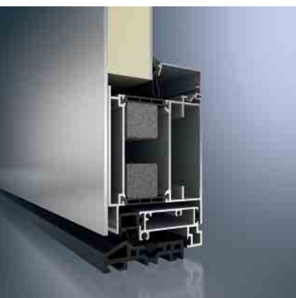
Schüco Tür-System ADS 75 HD.HI Schüco door system ADS 75 HD.HI

Extrem stabil, sehr belastbar und langlebig: Die Schüco Tür ADS 75 HD.HI eignet sich besonders gut für Gebäude mit hoher Besuchsfrequenz.