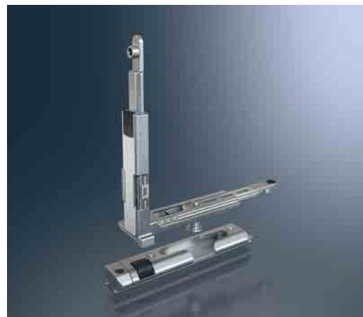
Eckumlenkung mit integrierter Schließrolle und Auflaufbock Corner drive with integrated locking roller and engagement block