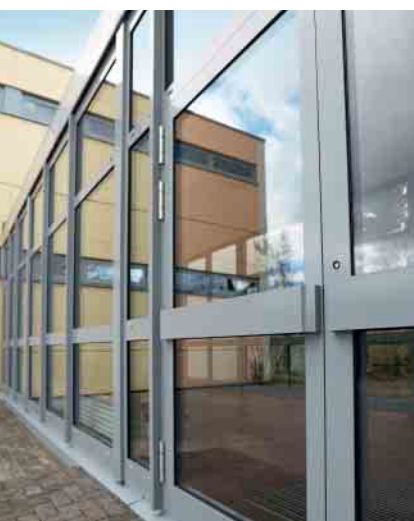
Schüco Aluminium-Türsystem ADS 50.NI Schüco Aluminium door system ADS 50.NI

Aluminium-Türsystem Aluminium Door System